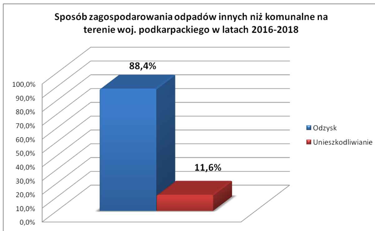
Rysunek 1: Sposób zagospodarowania odpadów innych niż komunalne na terenie województwa podkarpackiego, w latach 2016-2018.

Źródło: Opracowanie własne na podstawie danych WSO.